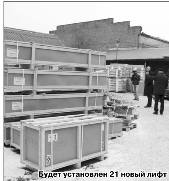
Будет установлен 21 новый лифт

Всего в ближайший месяц будет установлен 21 новый лифт. Это, конечно, не покроет всю нехватку новых подъемных машин во Владикавказе. Для того чтобы полностью заменить лифтовое хозяйство в столице респу-