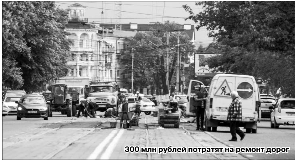
300 млн рублей потратят на ремонт дорог

– Глава АМС Борис Албегов уделяет развитию дорожного хозяйства большое внимание. Вы совершенно справедливо назвали эту отрасль социально значимой. Состояние и развитие дорожного хозяйства – это прежде всего обеспечение комфорта для жителей. В прошлом году основной акцент был сделан на проведение капитального и частичного ремонта владикавказских дорог. По итогам 2016 года средства на ремонт городских дорог – 250 млн руб. – были выделены исключительно из муниципального бюджета. На эти деньги нам удалось привести в порядок около 50 владикавказских улиц. В частности, улицы Гвардейская и Магкая, которые находились в плачевном состоянии. Работники дорожного хозяйства отремонтировали около 20 переездов, порядка 10 дворов и открыли новый регулируемый перекресток улиц А. Кесаева и Владикавказской.