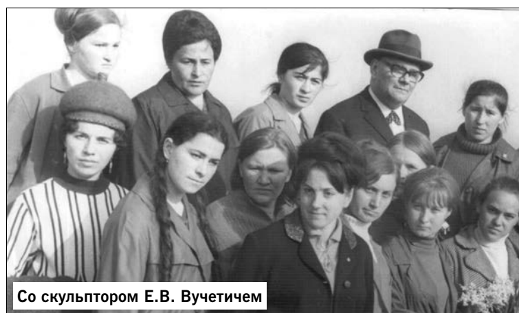
Со скульптором Е.В. Вучетичем