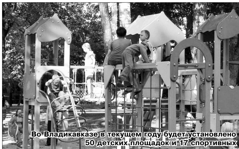
Во Владикавказе в текущем году будет установлено 50 детских площадок и 17 спортивных

– Я слежу за положением дел. В детском саду было 13 групп. В группе примерно 30 детей – по масштабам Владикавказа это довольно крупный детсад. Мною написано письмо на имя командующего 58-й армией Гурулева, я надеюсь, что мы