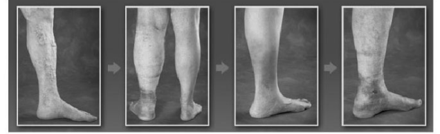
1. Варикозные вены 2. Опухоль ноги 3. Повреждение и изменение цвета кожи 4. Появление язв