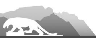
Перечень программных мероприятий