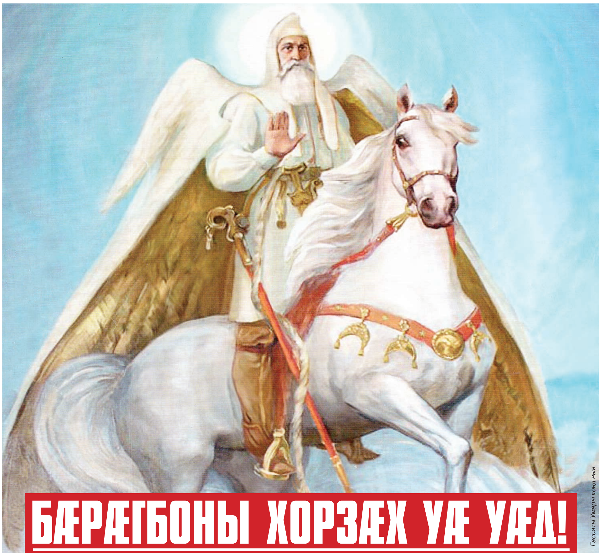
Гасситы Умары конд ныв