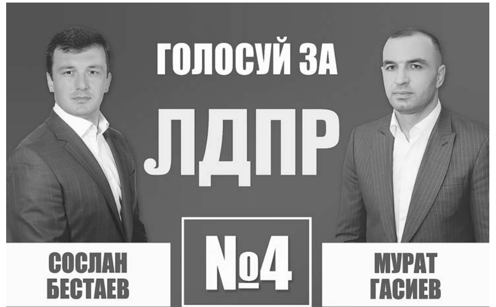
Предоставлена политической партии ЛДПР на безвозмездной основе.