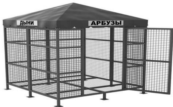
УТВЕРЖДЕНО постановлением администрации местного самоуправления г.Владикавказ от _____ г. № _____

Перечень специализаций нестационарных торговых объектов, минимальный ассортиментный перечень и номенклатура дополнительных групп товаров.