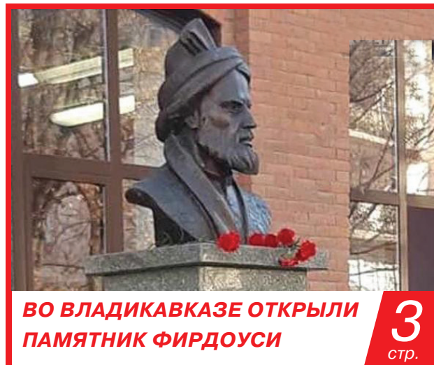
ВО ВЛАДИКАВКАЗЕ ОТКРЫЛИ ПАМЯТНИК ФИРДОУСИ