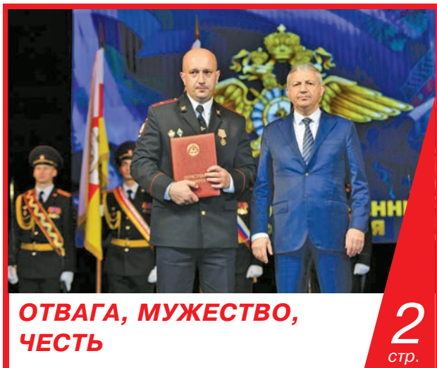
ОТВАГА, МУЖЕСТВО, ЧЕСТЬ

25 ЛЕТ НАЗАД БЫЛА ПРИНЯТА КОНСТИТУЦИЯ РЕСПУБЛИКИ СЕВЕРНАЯ ОСЕТИЯ – АЛАНИЯ