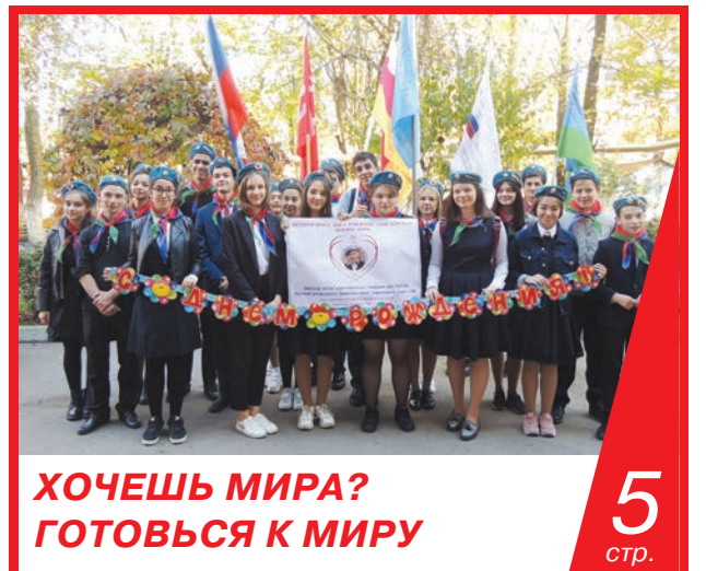
ХОЧЕШЬ МИРА? ГОТОВЬСЯ К МИРУ