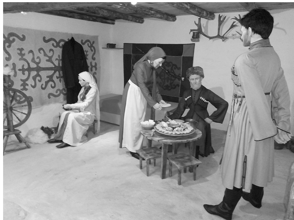
ФАРС БАЦÆТТÆ КОДТА КЪУДУХТЫ МАРИНÆ

Сывæллæттæ схъомыл кæнын хуымæтæг хъуыддаг нæу. Уыдон сты нæ царды дидинджытæ. Ныйарджытæ æмæ сывæллæтты 'хсæн æнгом ахастытæ хъуамæ уа. Уыдонмæ уæлдай хъусдард аздахын хъæуы, æнахъом кары ма куы уой, уæд.