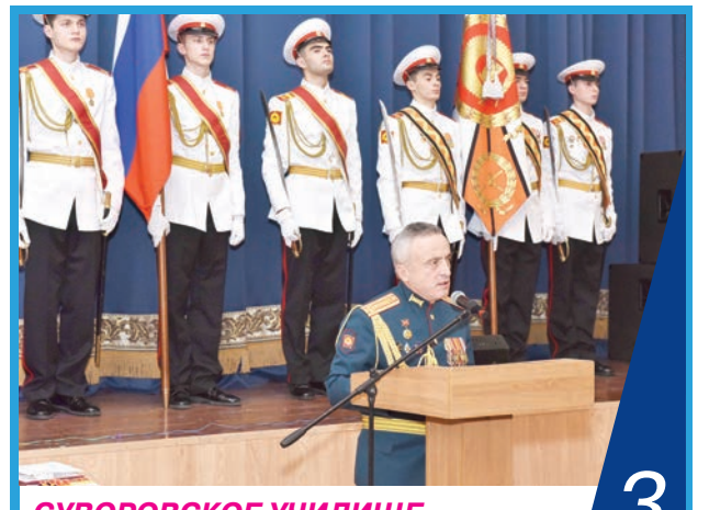
СУВОРОВСКОЕ УЧИЛИЩЕ ОТМЕТИЛО СВОЙ ДЕНЬ РОЖДЕНИЯ