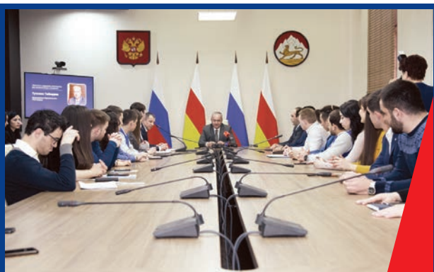
ВСТРЕЧА С МОЛОДЫМИ АКТИВИСТАМИ

ИСЧЕРПЫВАЮЩЕГО ОТВЕТА НА ЭТОТ ВОПРОС НЕТ ДО СИХ ПОР