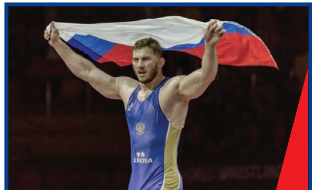
ТРИУМФ ОСЕТИНСКИХ БОРЦОВ