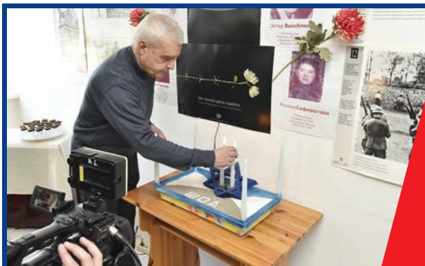
ПАМЯТИ ЖЕРТВ ХОЛОКОСТА