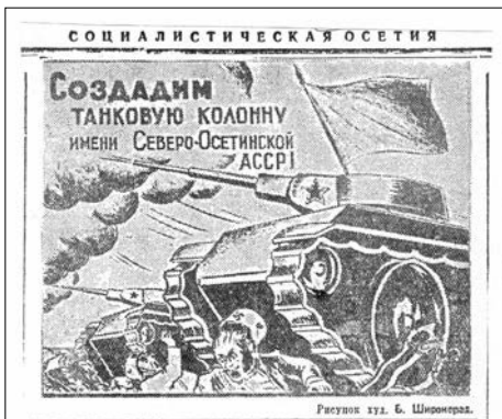
В фонд строительства танковой колонны

На общем собрании «Садонцветметтранса» коллектив принял решение отчислить однодневный заработок в фонд постройки новых танков. Токари т.т. Дзасохов, Голачков внесли наличными по 25 рублей каждый, шоферы