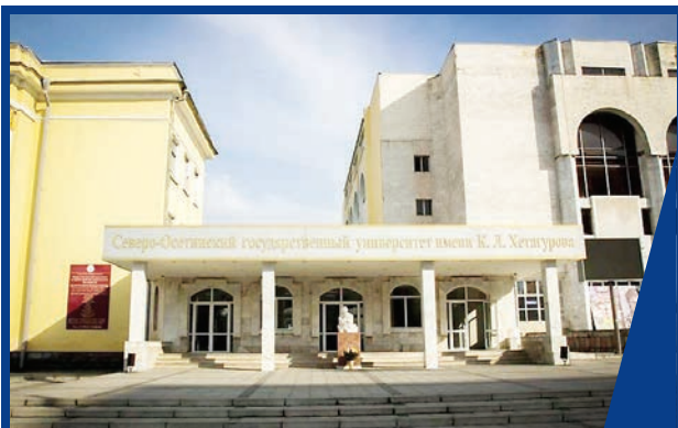
ВЕКОВОЙ ЮБИЛЕЙ ПРАЗДНУЕТ СОГУ ИМ. КОСТА ХЕТАГУРОВА