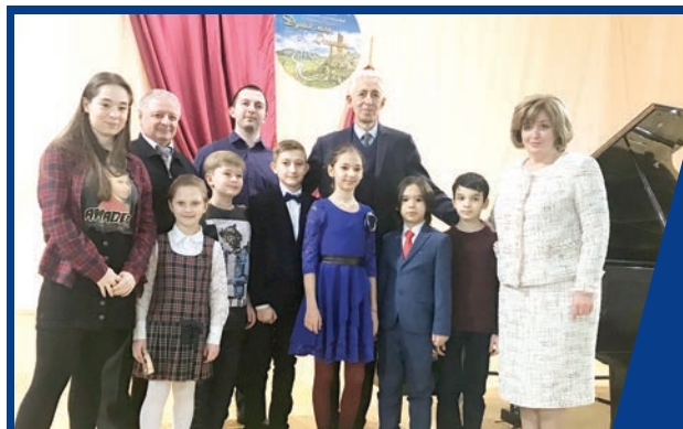
«ДУША МОЯ, ОСЕТИЯ...»