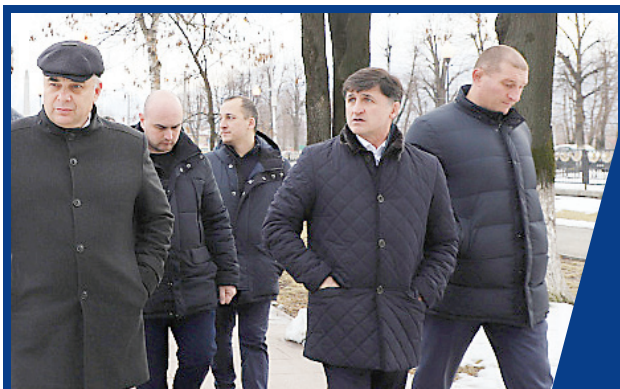
ТАМЕРЛАН ФАРНИЕВ ПРОИНСПЕКТИРОВАЛ СОСТОЯНИЕ ПАМЯТНИКОВ БОЕВОЙ СЛАВЫ

ГЕНЕРАЛ-ЛЕЙТЕНАНТ УРУЗМАГ ОГОЕВ НАГРАЖДЕН МНОГИМИ ОРДЕНАМИ И МЕДАЛЯМИ, НО САМОЙ БОЛЬШОЙ НАГРАДОЙ ДЛЯ СЕБЯ СЧИТАЕТ УВАЖЕНИЕ И ЛЮБОВЬ ЛЮДЕЙ