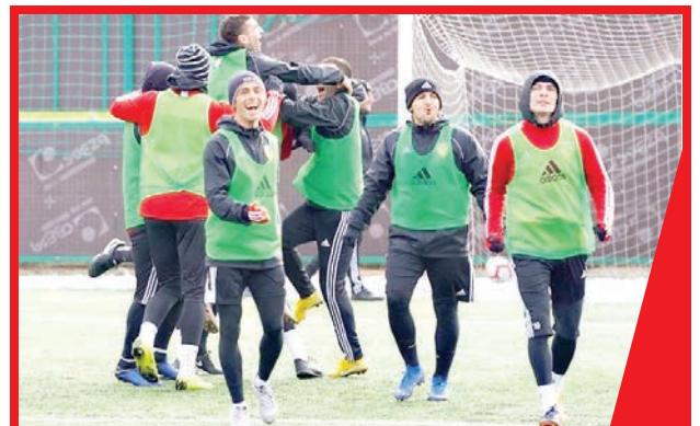
КРАСНО-ЖЕЛТЫЕ – УЖЕ В ТУРЦИИ