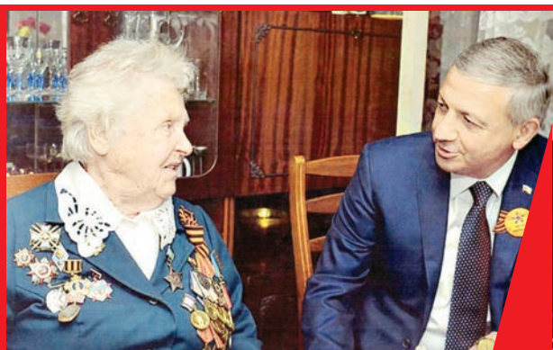
РАЗВЕДЧИЦА ФРОНТОВОГО НЕБА