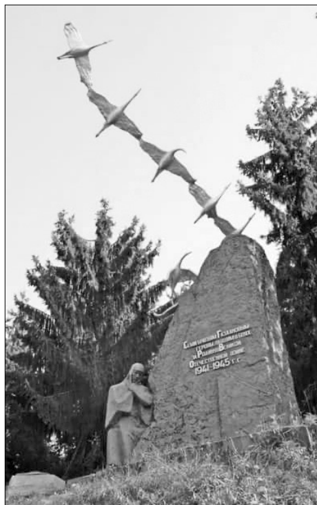
æмæ стыр аргъæй фæуæлахиз стæм цыфыддæр знагыл. Фронтмæ чысыл Ирыстон афæндарæст кодта 94 мин хæстоны, уыдонæй фæстæмæ нал

Тагъд – 75 азы уыдзæн, стыр Фыдыбæстæйы хæстыл куы фæуæлахиз стæм, уæдæй. Даргъ, уæззау æмæ тугкалæн уыдысты Советон адæмæн уыцы 1418 боны, фæлæ бабыхстой, бафæрæзтой æппæт зындзинæдтæн