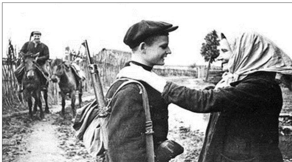
æрыздæхт 58 мин. Уыдон хæцыдысты хæсты æвирхъау уадтымыгъы, сæ уæхсчытыл рахастой йæ уæз æмæ æрхастой Уæлахиз.

Уыцы бон 1941 азы 22 июны фæсси-хор сау хабар æрыхъуыст Ирыстонмæ дæр – райдыдта Фыдыбæстæйы стыр