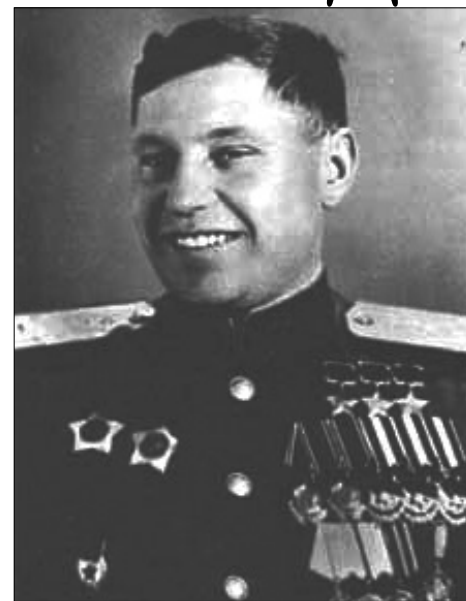
Член Центральной избирательной комиссии по выборам в Верховный Совет СССР, трижды Герой Советского Союза полковник А.И. Покрышкин (1945 год)

Указом Президиума Верховного Совета СССР от 7 июля 1945 года об амнистии в связи с победой над гитлеровской Германией были освобождены от наказания лица, осужденные к лишению свободы на срок не свыше трех лет и к более мягким мерам наказания, а также осужденные за самовольный уход с предприятий военной промышленности и других предприятий, на которые распространялось действие Указа Президиума Верховного Совета СССР от 26 декабря 1941 года, и военнослужащие, осужденные с отсрочкой исполнения приговора. От наказания также освобождались лица, осужденные за воинские преступления по пунктам 2, 5, 6, 7, 9, 10, 10а, 14, 15 и 16 статьи 193 Уголовного кодекса РСФСР и соответствующим статьям уголовных кодексов других союзных республик. Предписывалось прекратить производство по всем следственным делам и не рассмотренных судами делам, о преступлениях, совершенных до издания настоящего Указа. Значительную их часть составили дела об уклонении от мобилизации в армию, о дезертирстве, самовольном оставлении части. Тем самым амнистированные вчерашние дезертиры были восстановлены