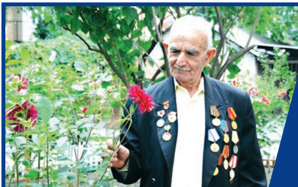
К 75-ЛЕТИЮ ВЕЛИКОЙ ПОБЕДЫ