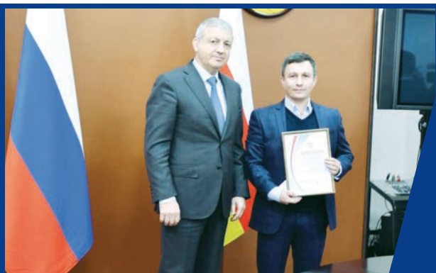
ВРУЧЕНИЕ ПРЕМИЙ ГЛАВЫ РЕСПУБЛИКИ В ОБЛАСТИ НАУКИ И ТЕХНИКИ

«В ЭКОЛОГИЮ НАДО ВКЛАДЫВАТЬ НЕ ТОЛЬКО ДЕНЬГИ, НО И ДУШУ»