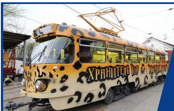
ВО ВЛАДИКАВКАЗЕ ВОССТАНОВЛЕНО ТРАМВАЙНОЕ ДВИЖЕНИЕ