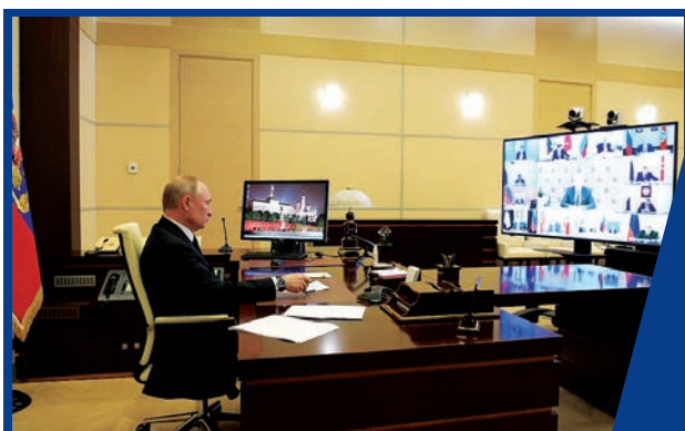
ОБРАЩЕНИЕ ПРЕЗИДЕНТА РОССИЙСКОЙ ФЕДЕРАЦИИ ВЛАДИМИРА ПУТИНА