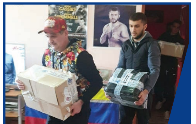
ПОМОЩЬ ЛЮДЯМ В БЕДЕ