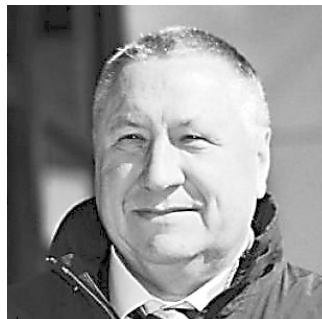
Владимир СИНЯГОВСКИЙ, депутат Государственной думы ФС РФ

на жительство даже в прошлом. Думаю, не нужно объяснять насколько эти нормы отвечают сегодняшним запросам российского общества. Изменения в Основном Законе необходимо рассматривать в комплексе, и тогда становится понятно, что в основе конституционной реформы лежат не теоретические размышления, а реальное законодательное наполнение демократических и социальных норм. Предлагае-