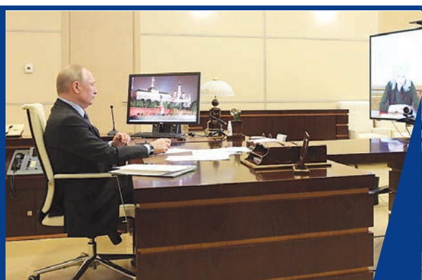
«БЛИЖАЙШИЕ НЕДЕЛИ СТАНУТ ОПРЕДЕЛЯЮЩИМИ»