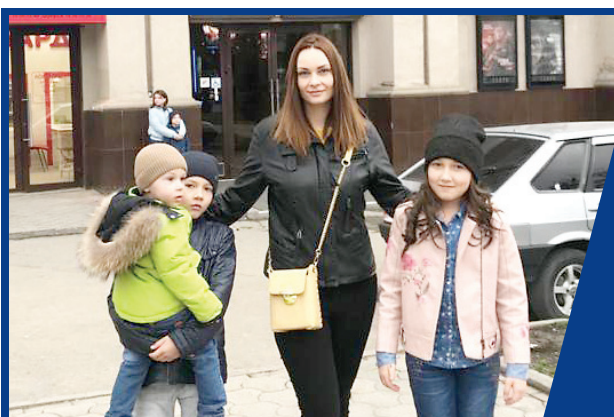
УСТОЯТЬ И ОКРЕПНУТЬ