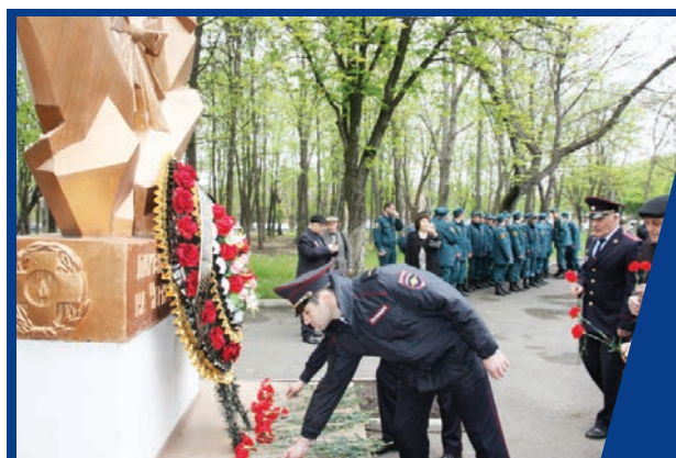
ВСПОМНИМ ПАВШИХ ГЕРОЕВ ЧЕРНОБЫЛЯ