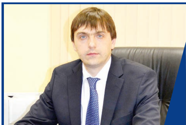
СЕРГЕЙ КРАВЦОВ: «МЫ НЕ ЗАМЕНИМ ШКОЛУ ДИСТАНЦИОННЫМ ОБУЧЕНИЕМ»