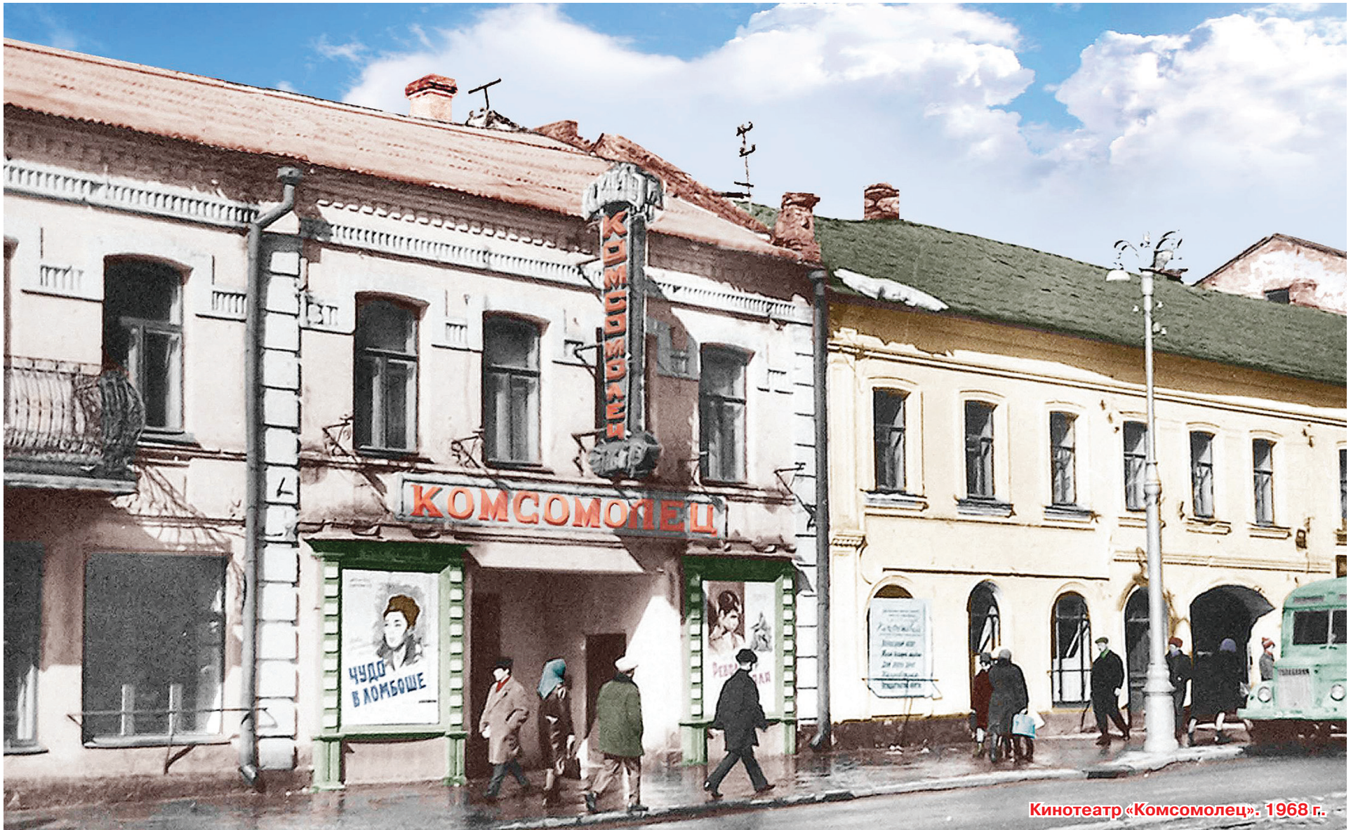
Кинотеатр «Комсомолец»: 1968 г.