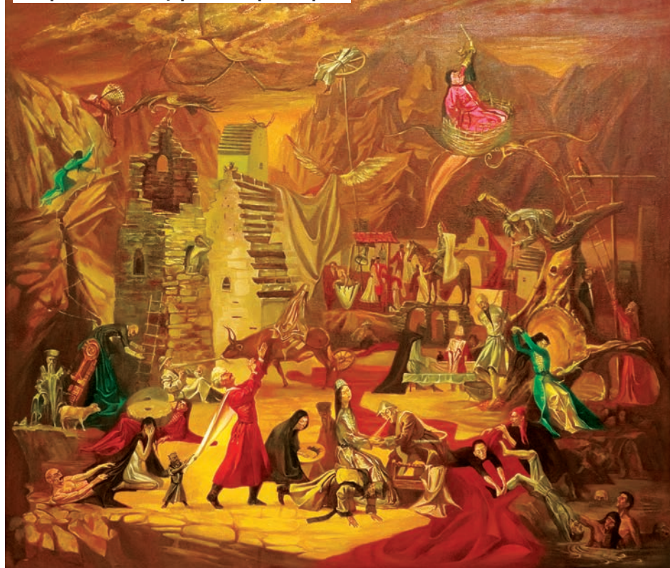
«Нарт Сослан в Царстве Барастыра»