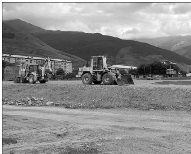
ИДЕТ АКТИВНОЕ СТРОИТЕЛЬСТВО СПОРТИВНОГО СТАДИОНА