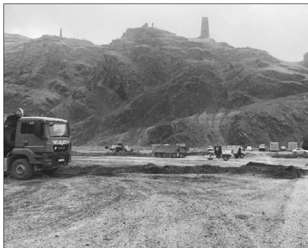
ЗАВЕРШЕНА РЕКУЛЬТИВАЦИЯ ФИАГДОНСКОГО ХВОСТОХРАНИЛИЩА