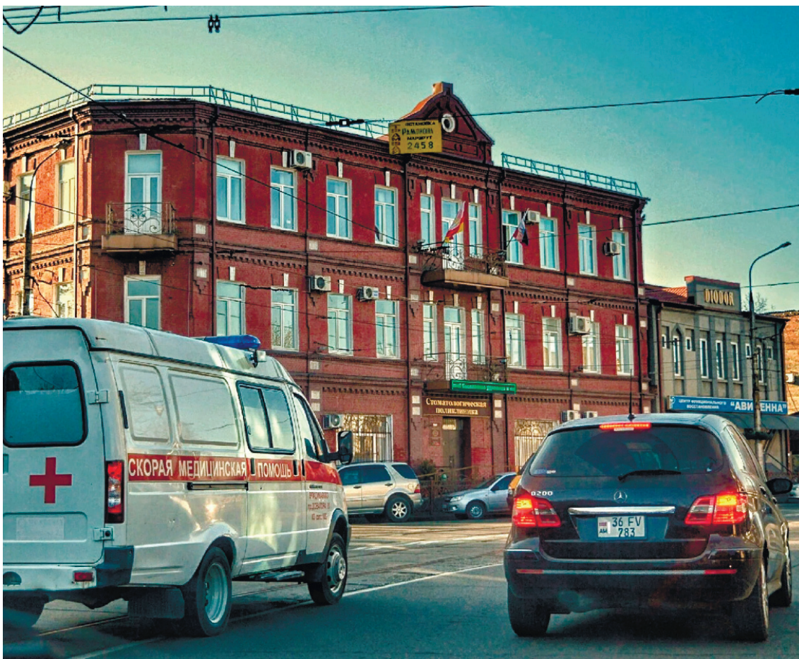
– Армения подписала договор о вступлении в Евразийский экономический союз, Беларусь, Казахстан и Киргизия, с условием, что маши-