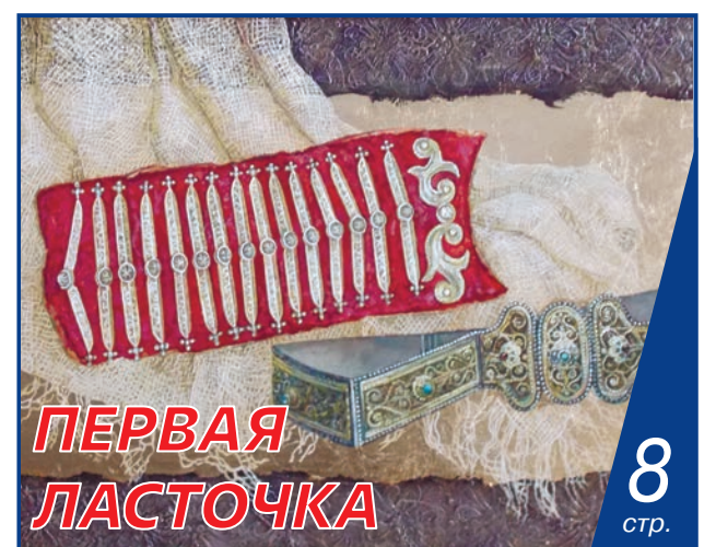
ПЕРВАЯ ЛАСТОЧКА 8 стр.