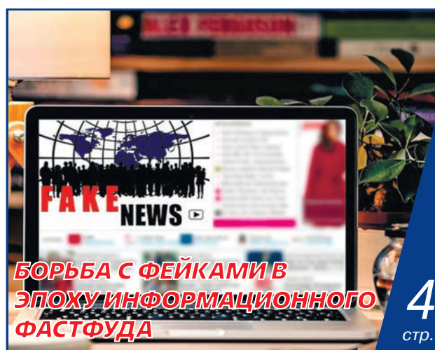
БОРЬБА С ФЕЙКАМИ В ЭПОХУ ИНФОРМАЦИОННОГО ФАСТФУДА 4 стр.