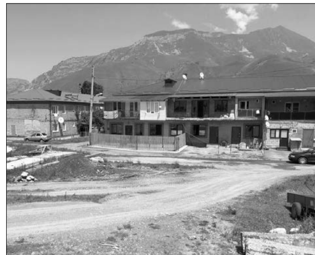
НА ЗАВЕРШАЮЩЕЙ СТАДИИ ВОПРОС ГАЗИФИКАЦИИ ДВУХ МНОГОЭТАЖНЫХ ДОМОВ