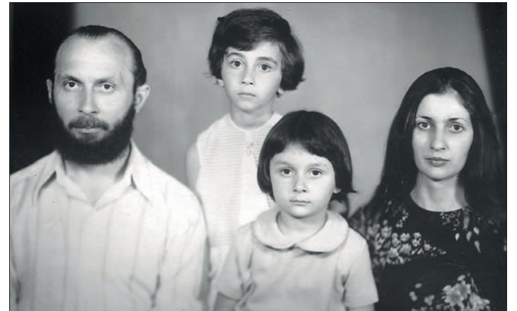
Поэт йæ бинонтимæ