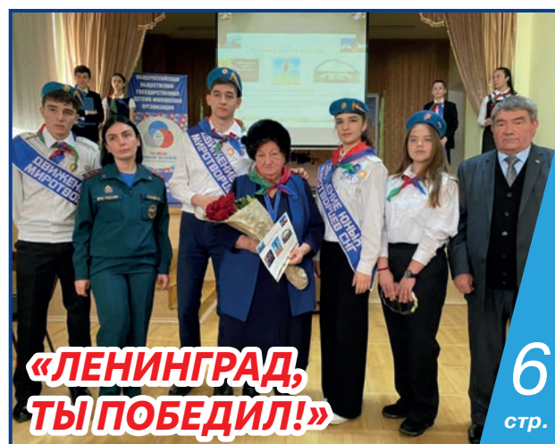
«ЛЕНИНГРАД, ТЫ ПОБЕДИЛ!»