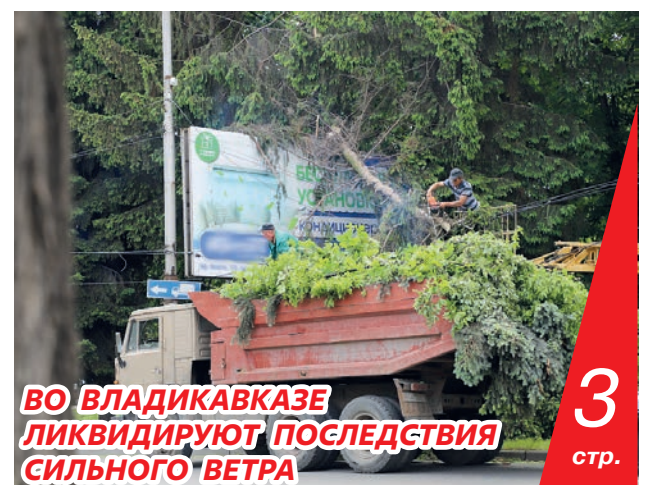
ВО ВЛАДИКАВКАЗЕ ЛИКВИДИРУЮТ ПОСЛЕДСТВИЯ СИЛЬНОГО ВЕТРА