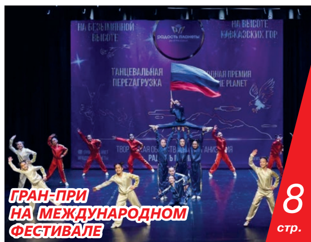
ГРАН-ПРИ НА МЕЖДУНАРОДНОМ ФЕСТИВАЛЕ