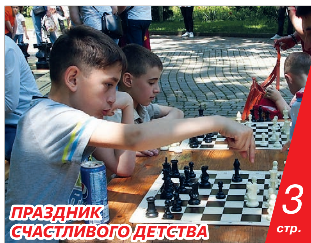
ПРАЗДНИК СЧАСТЛИВОГО ДЕТСТВА