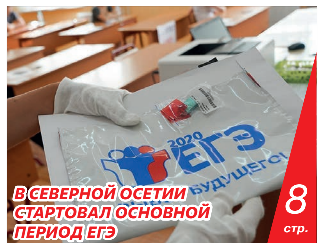
В СЕВЕРНОЙ ОСЕТИИ СТАРТОВАЛ ОСНОВНОЙ ПЕРИОД ЕТЭ