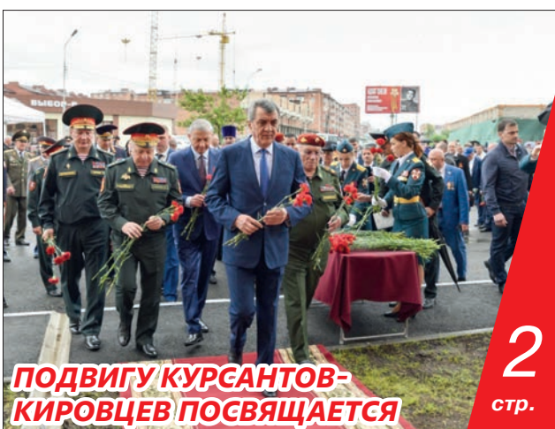
ПОДВИГУ КУРСАНТОВ-КИРОВЦЕВ ПОСВЯЩАЕТСЯ