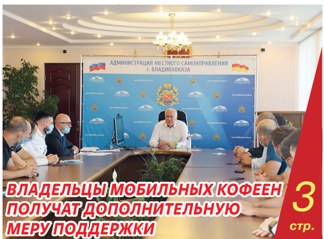
ВЛАДЕЛЬЦЫ МОБИЛЬНЫХ КОФЕЕН ПОЛУЧАТ ДОПОЛНИТЕЛЬНУЮ МЕРУ ПОДДЕРЖКИ

– это прежде всего социальный вопрос, вопрос укрепления российской семьи, если хотите. Он давно уже вышел из разряда частных и вступил в разряд государственных. Поэтому и решать его надо по-государственному, решительно и эффективно.