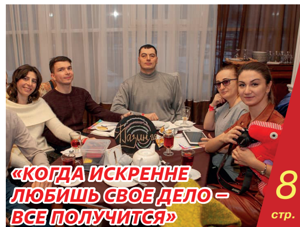
«КОГДА ИСКРЕННЕ ЛЮБИШЬ СВОЕ ДЕЛО – ВСЕ ПОЛУЧИТСЯ»