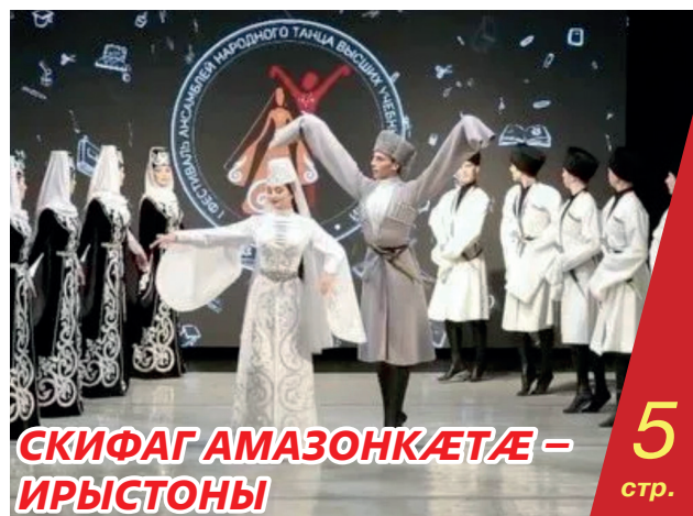
СКИФАГ АМАЗОНКАЕТАЕ – ИРЫСТОНЫ