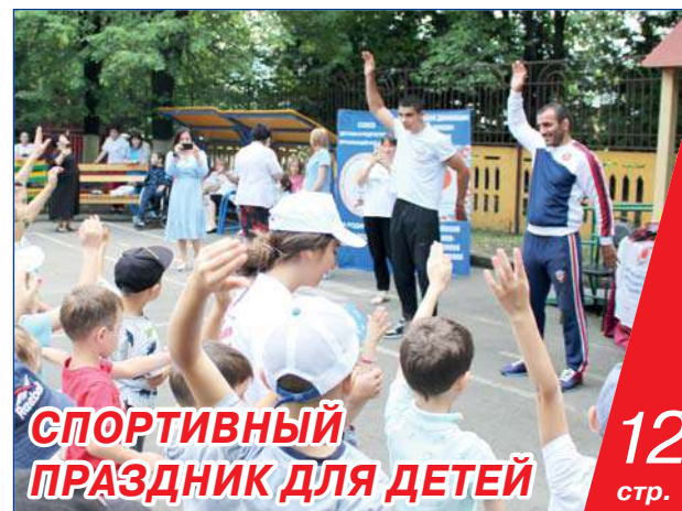
СПОРТИВНЫЙ ПРАЗДНИК ДЛЯ ДЕТЕЙ