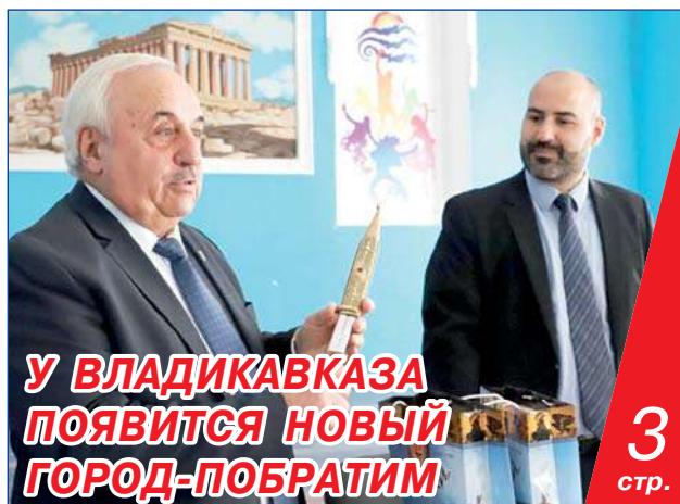
У ВЛАДИКАВКАЗА ПОЯВИТСЯ НОВЫЙ ГОРОД-ПОБРАТИМ