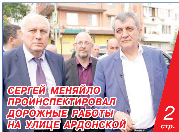
СЕРГЕЙ МЕНЯЙЛО ПРОИНСПЕКТИРОВАЛ ДОРОЖНЫЕ РАБОТЫ НА УЛИЦЕ АРДОНСКОЙ

ВО ВЛАДИКАВКАЗЕ ВПЕРВЫЕ ПРОШЛА МЕЖДУНАРОДНАЯ КНИЖНАЯ ЯРМАРКА-ФЕСТИВАЛЬ НАЦИОНАЛЬНОЙ КНИГИ