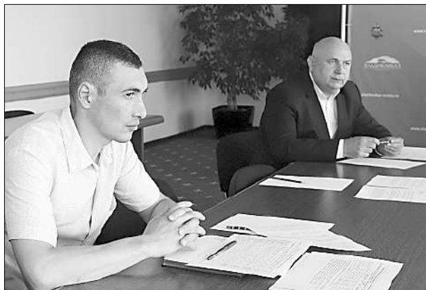
Вторым вопросом повестки дня стало «Состояние работ по учету, содержанию и эксплуатации защитных сооружений, расположенных на территории г. Владикавказа».