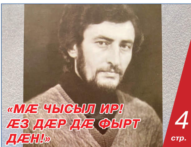
«МÆ ЧЫСЫЛ ИР! ÆЗ ДÆР ДÆ ФЫРТ ДÆН!»