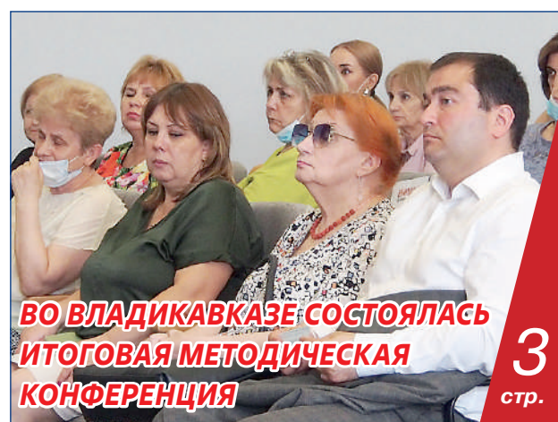
ВО ВЛАДИКАВКАЗЕ СОСТОЯЛАСЬ ИТОГОВАЯ МЕТОДИЧЕСКАЯ КОНФЕРЕНЦИЯ