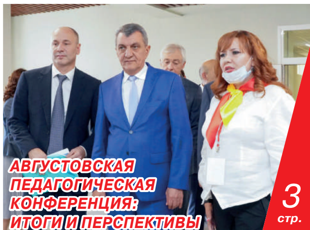
АВГУСТОВСКАЯ ПЕДАГОГИЧЕСКАЯ КОНФЕРЕНЦИЯ: ИТОГИ И ПЕРСПЕКТИВЫ