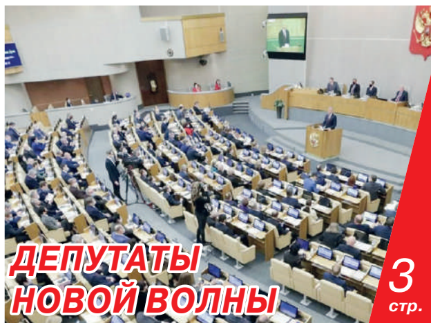
ДЕПУТАТЫ НОВОЙ ВОЛНЫ