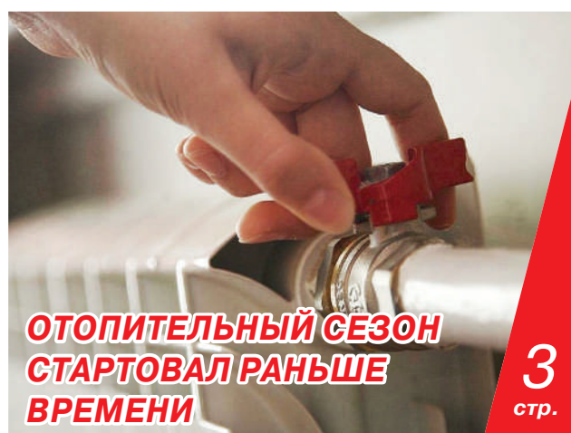
ОТОПИТЕЛЬНЫЙ СЕЗОН СТАРТОВАЛ РАНЬШЕ ВРЕМЕНИ 3 стр.