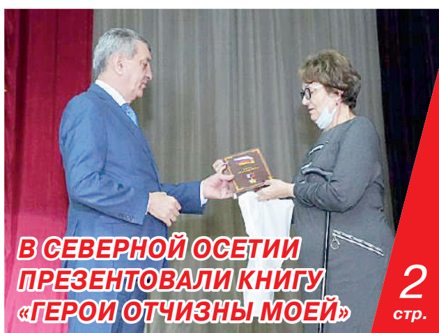
В СЕВЕРНОЙ ОСЕТИИ ПРЕЗЕНТОВАЛИ КНИГУ «ГЕРОИ ОТЧИЗНЫ МОЕЙ» 2 стр.

ПО РЕКОМЕНДАЦИИ РОСПОТРЕБНАДЗОРА В ЦЕЛЯХ МИНИМИЗАЦИИ РИСКОВ РАСПРОСТРАНЕНИЯ COVID-19 И ГРИППА ЗАКРЫТЫЕ КЛАССЫ ПЕРЕВОДЯТСЯ НА ДИСТАНЦИОННОЕ ОБУЧЕНИЕ