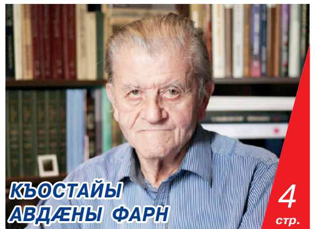
КЪОСТАЙЫ АВДЕНЫ ФАРН