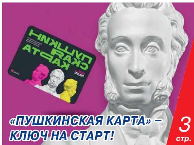
«ПУШКИНСКАЯ КАРТА» – КЛЮЧ НА СТАРТ!