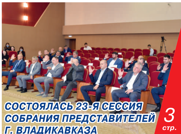
СОСТОЯЛАСЬ 23-Я СЕССИЯ СОБРАНИЯ ПРЕДСТАВИТЕЛЕЙ Г. ВЛАДИКАВКАЗА