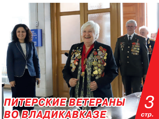
ПИТЕРСКИЕ ВЕТЕРАНЫ ВО ВЛАДИКАВКАЗЕ