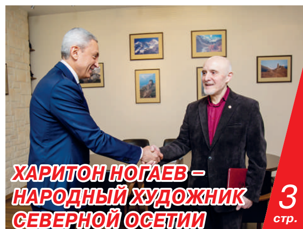
ХАРИТОН НОГАЕВ – НАРОДНЫЙ ХУДОЖНИК СЕВЕРНОЙ ОСЕТИИ