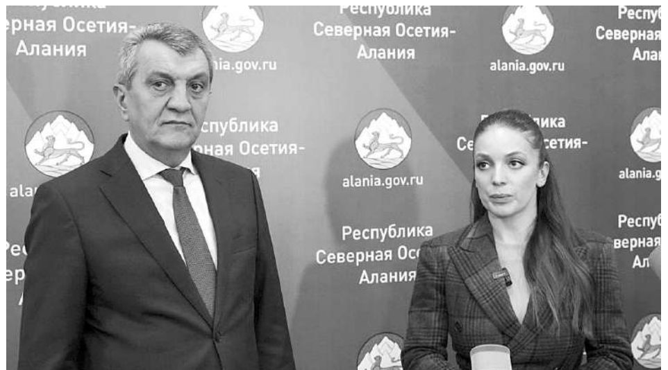
ЗАРИНА ДОГУЗОВА, РУКОВОДИТЕЛЬ ФЕДЕРАЛЬНОГО АГЕНТСТВА ПО ТУРИЗМУ: ВСЕ УСЛОВИЯ ДЛЯ РАЗВИТИЯ ТУРИЗМА ЕСТЬ

В настоящее время продолжается активный сбор заявок населения на подведение газа. Подать заявку на подключение возможно как через клиентский центр ООО «Газпром газораспределение Владикавказ», так и в развернутых мобильных пунктах.