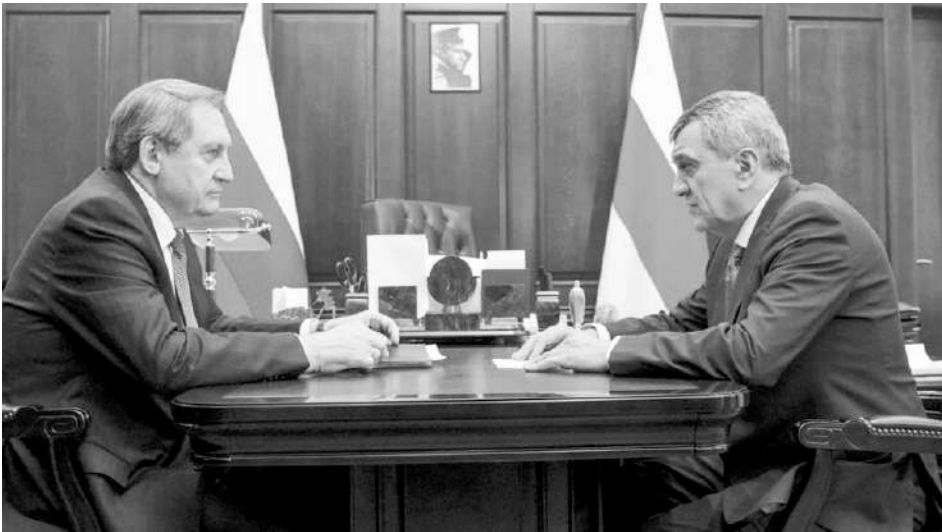
НИКОЛАЙ ШУЛЬГИНОВ, МИНИСТР ЭНЕРГЕТИКИ РФ: «УРОВЕНЬ ГАЗИФИКАЦИИ РЕСПУБЛИКИ ДОСТИГАЕТ ПОЧТИ 90%»