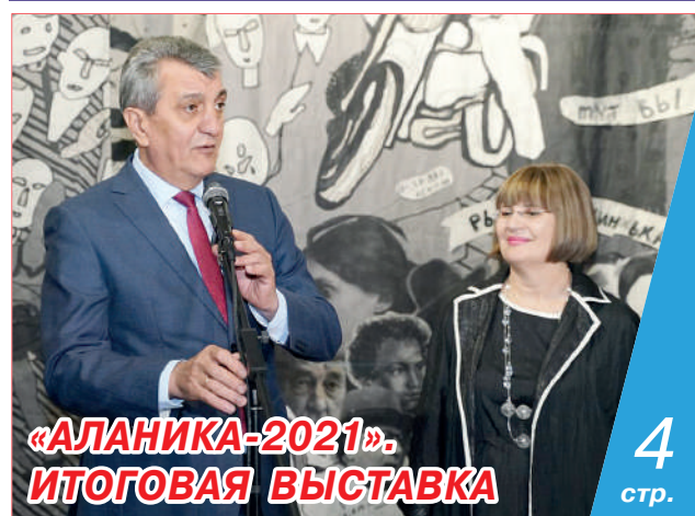
«АЛАНИКА-2021». ИТОГОВАЯ ВЫСТАВКА

ли при спасении детей. Гости посетили бывшую первую бесланскую школу и строящийся во дворе разрушенного учебного здания храм Воскресения Христова. Напомним, роспись стен храма проводится при поддержке руководства «Авторадио».