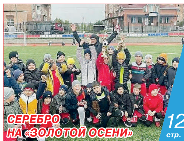
СЕРЕБРО НА «ЗОЛОТОЙ ОСЕНИ»