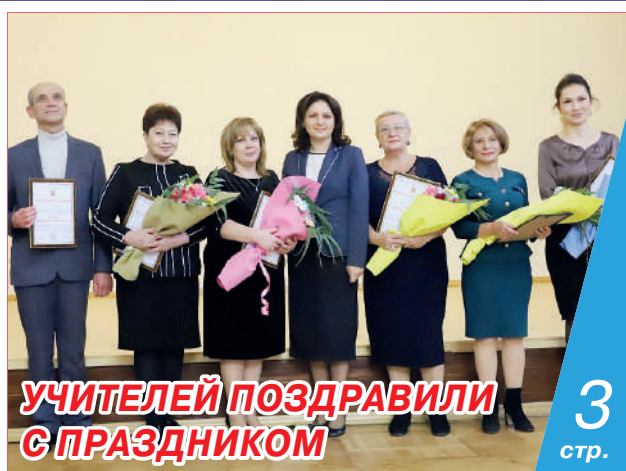
УЧИТЕЛЕЙ ПОЗДРАВИЛИ С ПРАЗДНИКОМ