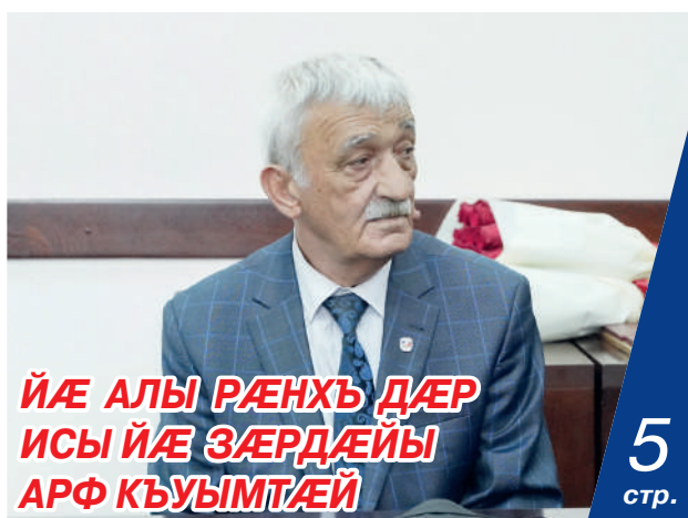
ЙÆ АЛЫ РÆНХЪ ДÆР ИСЫ ЙÆ ЗÆРДÆЙЫ АРФ КЪУЫМТÆЙ