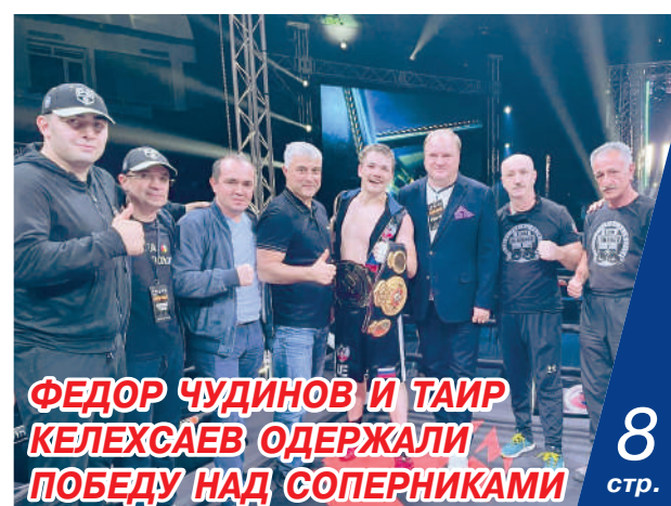
ФЕДОР ЧУДИНОВ И ТАИР КЕЛЕХСАЕВ ОДЕРЖАЛИ ПОБЕДУ НАД СОПЕРНИКАМИ