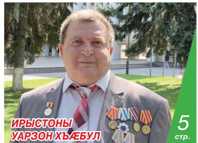
ИРЫСТОНЫ УАРЗОН ХЪАБУЛ