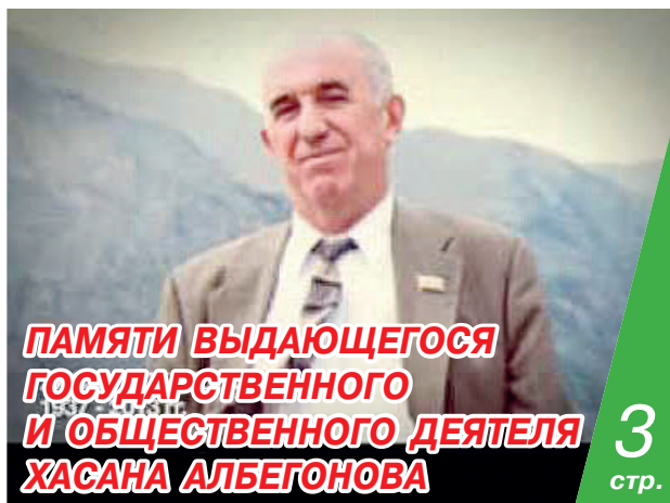
ПАМЯТИ ВЫДАЮЩЕГОСЯ ГОСУДАРСТВЕННОГО И ОБЩЕСТВЕННОГО ДЕЯТЕЛЯ ХАСАНА АЛБЕГОНОВА