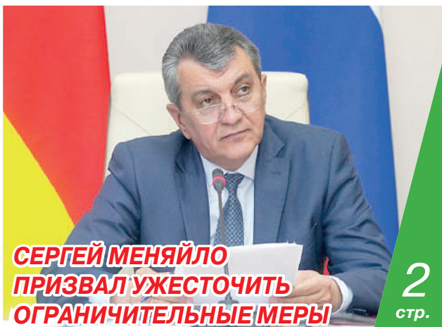
СЕРГЕЙ МЕНЯЙЛО ПРИЗВАЛ УЖЕСТОЧИТЬ ОГРАНИЧИТЕЛЬНЫЕ МЕРЫ

Стоит отметить, что правительство намерено оказать поддержку отраслям малого и среднего бизнеса.