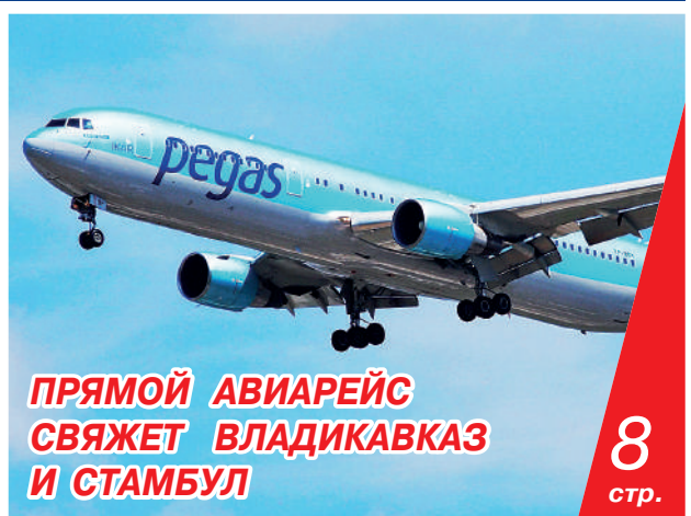
ПРЯМОЙ АВИАРЕЙС СВЯЖЕТ ВЛАДИКАВКАЗ И СТАМБУЛ