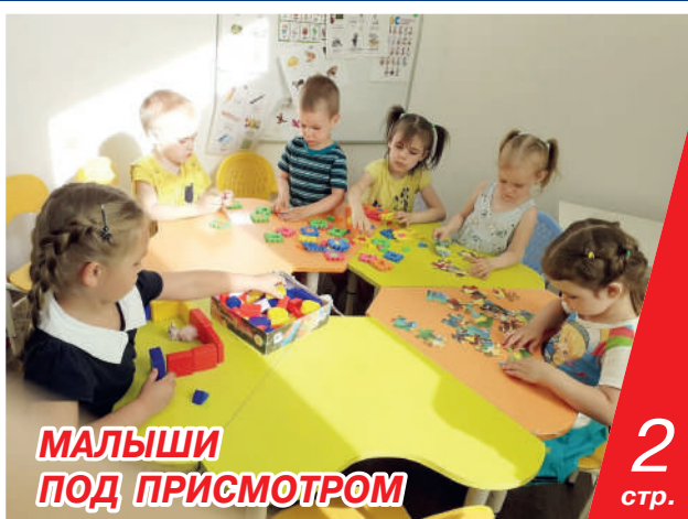
МАЛЫШИ ПОД ПРИСМОТРОМ