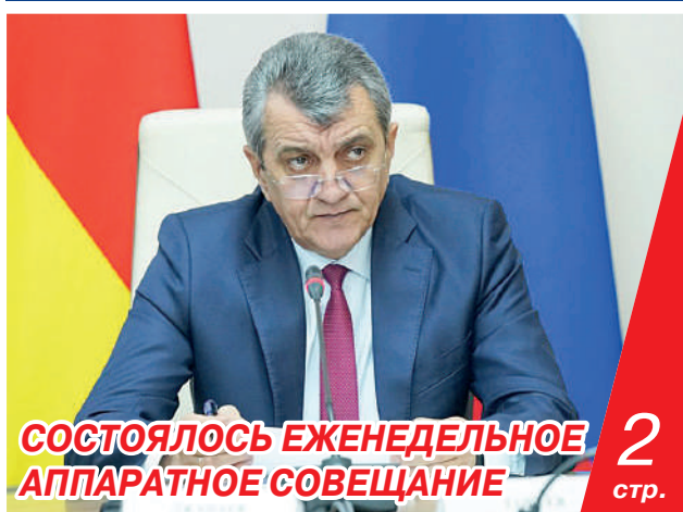
СОСТОЯЛОСЬ ЕЖЕНЕДЕЛЬНОЕ АППАРАТНОЕ СОВЕЩАНИЕ