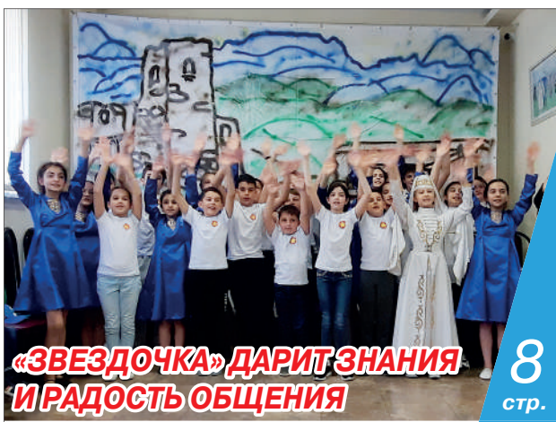
«ЗВЕЗДОЧКА» ДАРИТ ЗНАНИЯ И РАДОСТЬ ОБЩЕНИЯ