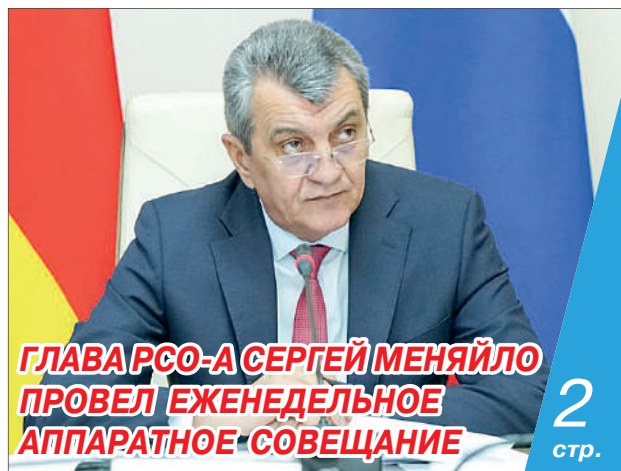
ГЛАВРСО-А СЕРГЕЙ МЕНЯЙЛО ПРОВЕЛ ЕЖЕНЕДЕЛЬНОЕ АППАРАТНОЕ СОВЕЩАНИЕ

дорогах. Проекционная «зебра» будет видна на любом дорожном покрытии. Специальный лазерный проектор подсвечивает пешеходный переход, чтобы существующую дорожную разметку было видно издалека в темное время суток, в дождь, снег или туман.