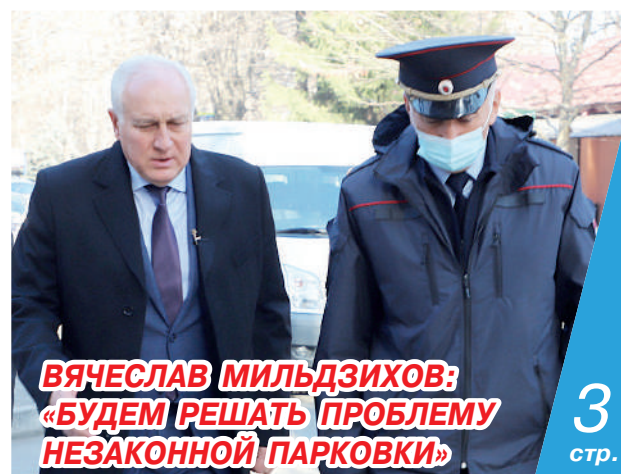
ВЯЧЕСЛАВ МИЛЬДЗИХОВ: «БУДЕМ РЕШАТЬ ПРОБЛЕМУ НЕЗАКОННОЙ ПАРКОВКИ»