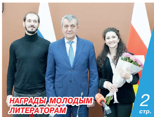
НАГРАДЫ МОЛОДЫМ ЛИТЕРАТОРАМ

ставы будут курсировать с разницей в 30 минут. Ежедневно до конца новогодних выходных все желающие смогут прокатиться по столичному кольцу и ощутить праздничное настроение.