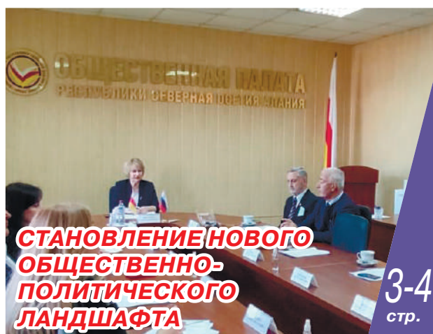
СТАНОВЛЕНИЕ НОВОГО ОБЩЕСТВЕННО-ПОЛИТИЧЕСКОГО ЛАНДШАФТА