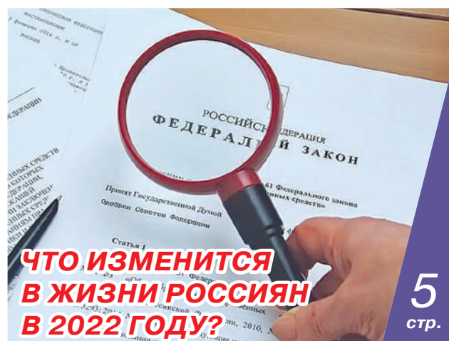
ЧТО ИЗМЕНИТСЯ В ЖИЗНИ РОССИЯН В 2022 ГОДУ?