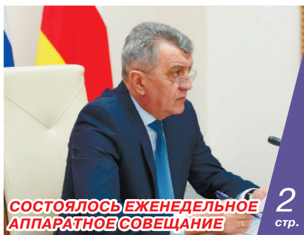
СОСТОЯЛОСЬ ЕЖЕНЕДЕЛЬНОЕ АППАРАТНОЕ СОВЕЩАНИЕ

мечательным событием и вручило подарочные наборы для новорожденных. Эта мера поддержки учреждена в республике с 2022 года по инициативе Главы РСО-А Сергея Меняйло.