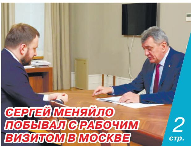
СЕРГЕЙ МЕНЯЙЛО ПОБЫВАЛ С РАБОЧИМ ВИЗИТОМ В МОСКВЕ