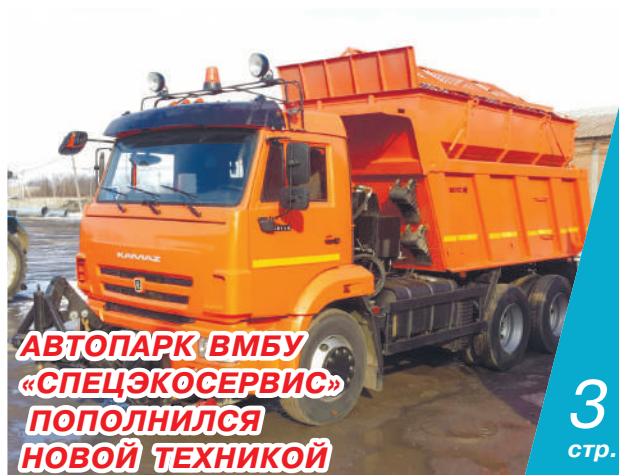
АВТОПАРК ВМБУ «СПЕЦЭКОСЕРВИС» ПОПОЛНИЛСЯ НОВОЙ ТЕХНИКОЙ