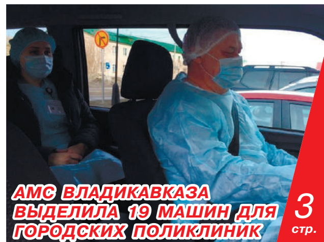
АМС ВЛАДИКАВКАЗА ВЫДЕЛИЛА 19 МАШИН ДЛЯ ГОРОДСКИХ ПОЛИКЛИНИК