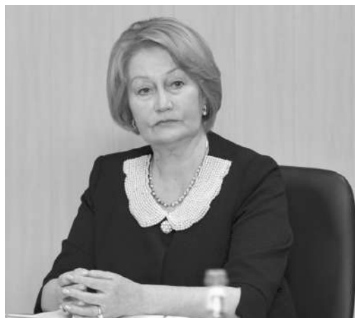
Нина ЧИПЛАКОВА, председатель Общественной палаты РСО-А

– Мы ориентированы на эффективную работу с профильными экспертами института. Действительно, тема школьного питания крайне важна для нас. В этом году нам предстоит серьезная работа – республика вошла в пятерку субъектов РФ по объему федерального финансирования, одобренного на 2022–2023 гг. на капитальный ремонт образовательных организаций. Мы капитально отремонтируем 63 школы, особое внимание уделим модернизации пищеблоков, учтем все требования, которые необходимы для обеспечения школьников вкусным и полезным питанием. Этот шаг крайне важен для разработки надежной и устойчивой системы школьного питания республики, – резюмировал Сергей Меняйло.