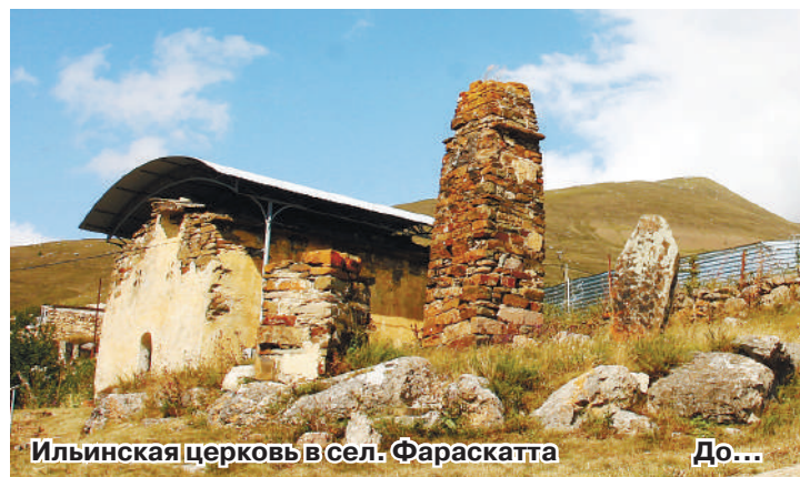
Ильинская церковь в сел. Фараскатта