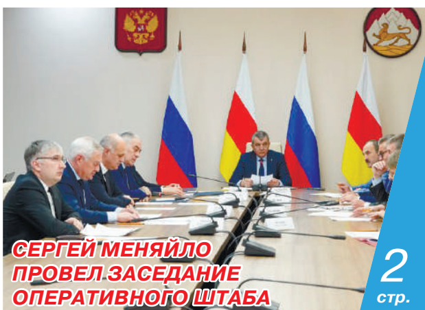
СЕРГЕЙ МЕНЯЙЛО ПРОВЕЛ ЗАСЕДАНИЕ ОПЕРАТИВНОГО ШТАБА

НА ВЛАДИКАВКАЗСКОМ ЗАВОДЕ СТАЛИ ПРОИЗВОДИТЬ БЕСКИСЛОРОДНУЮ МЕДЬ