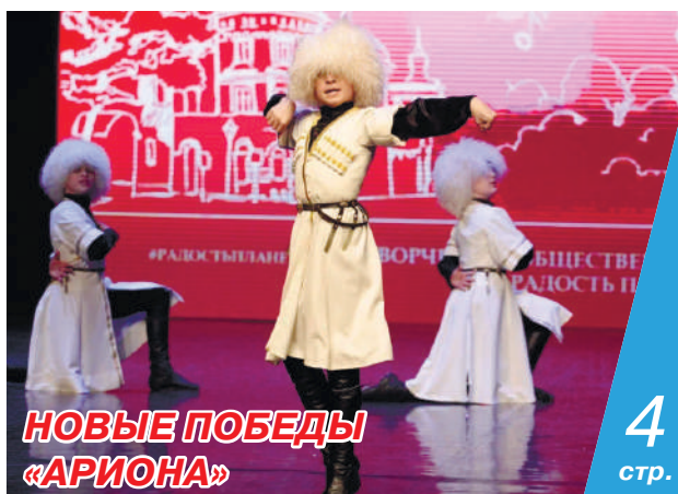
НОВЫЕ ПОБЕДЫ «АРИОНА»