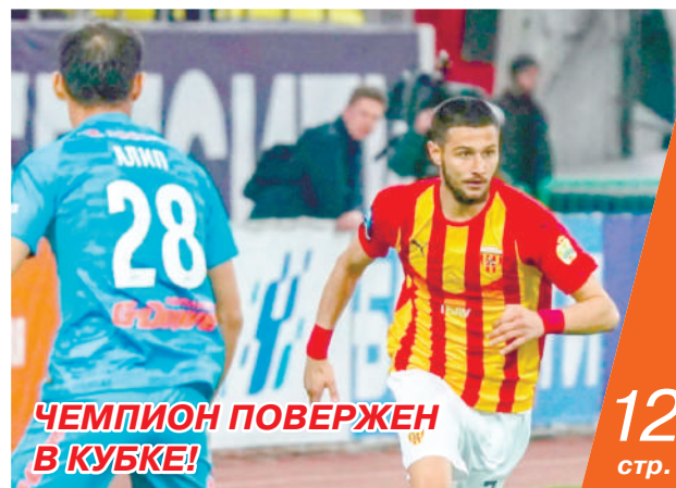
ЧЕМПИОН ПОВЕРЖЕН В КУБКЕ!