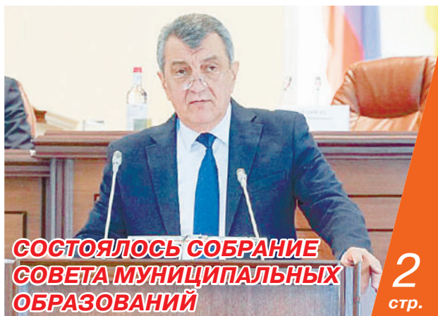
СОСТОЯЛОСЬ СОБРАНИЕ СОВЕТА МУНИЦИПАЛЬНЫХ ОБРАЗОВАНИЙ