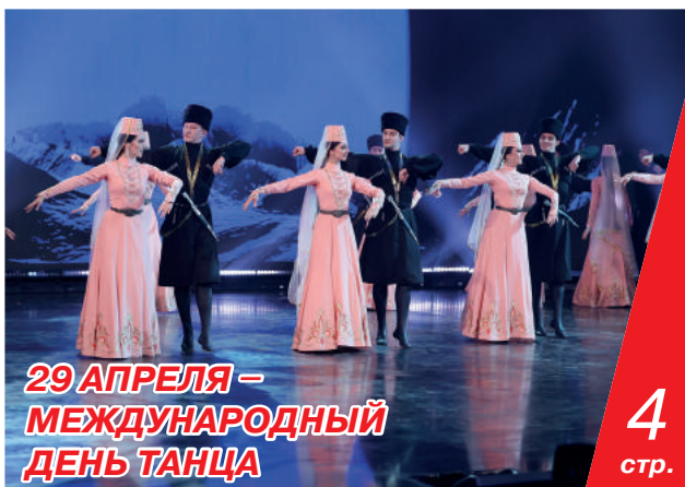
29 АПРЕЛЯ – МЕЖДУНАРОДНЫЙ ДЕНЬ ТАНЦА