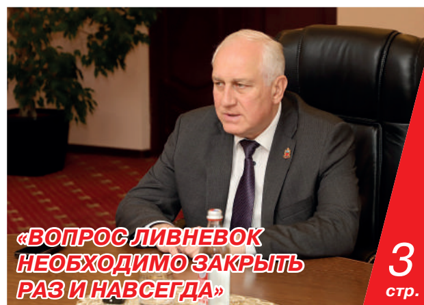
«ВОПРОС ЛИВНЕВОК НЕОБХОДИМО ЗАКРЫТЬ РАЗ И НАВСЕГДА»