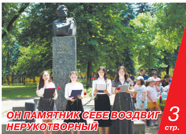
ОН ПАМЯТНИК СЕБЕ ВОЗДВИГ НЕРУКОТВОРНЫЙ 3 стр.

магонд хæстон операци цæуы, уырдаæм нæ фæсивæд цæуынц уæндонæй, æхсарджынæй, ныфсджынæй. Цæуынц, Уæрæсейыл апырх кæнынмæ цы рын хъавы – нацизм, уый ныххурх кæнынмæ, Райгуыраен бæстæе нацисттæй бахъахъхъæнынмæ. Æмæ тохы быдыры æвдисынц диссаджы сгуйхтдзинаедтæ.