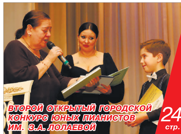
ВТОРОЙ ОТКРЫТЫЙ ГОРОДСКОЙ КОНКУРС ЮНЫХ ПИАНИСТОВ ИМ. З.А. ЛОЛАЕВОЙ 24 стр.