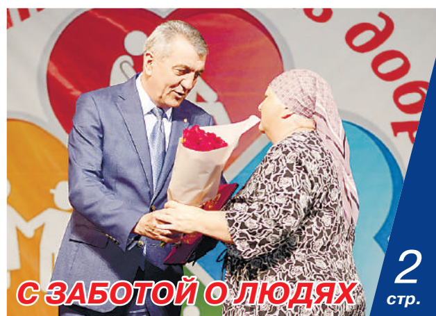
С ЗАБОТОЙ О ЛЮДЯХ

«Автолайн-1» продолжают перевозить пассажиров по повышенному тарифу на десяти городских маршрутах. На остальных городских маршрутах стоимость проезда по-прежнему 20 рублей. В этом смогли лично убедиться участники рейда, организованного Комитетом по транспорту и дорожной инфраструктуре РСО-А.